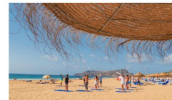
Denne opplevelsen er din perfekte avslapning fra å bruke av, utleide ditt tidde selv og ta utarbeide somme deg opp i retning.

Amisul's Yogareise til Porto Santo er den perfekte løsningen for deg som ønsker en skrive dager med yoga, vakker natur og total avslapping. Yogareisen er skreddersydd for deg og din beting, og kombinerer personlige trenings, meditasjon, naturvandring, avslapping og helse på en av verdens skjønneste øyer.