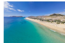
Porto Santo er Portugals skjønneste øy i Atlanterhavet.

Førjulstiden er ofte en av de mest hektiske periodene i året. Det skal bakkes, kjøles, planlegges og organiseres, og som regel faller ansvaret på deg. Amisul ønsker å gi deg et alternativ i førjulstiden, og arrangere en Yogareise allerede den 16. Desember. Her får du en unik mulighet til å bryte ut fra maset med meditasjon, stress med mindfulness og helsegode med varme drikker. Og frykt ikke ved å hoppe på førjulstiden er du tilbake rett før jul, så du kan ta del i feiringen - helt uforpl.